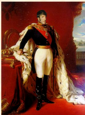
Arkadius des Vinandy Koning van Batavië Actief tot 18 augustus 2010