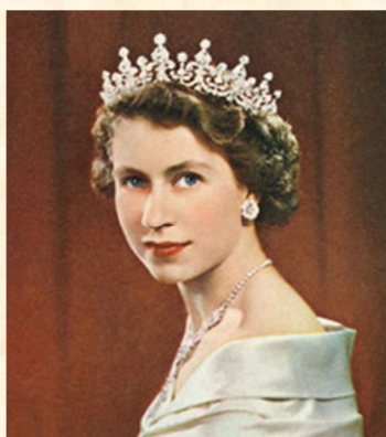
Fränzi-Ferdinanda des Vinandy Koningin van Batavië Sinds 2 maart 2010 actief