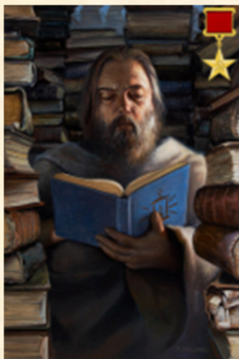
Hendrik II Graaf van Lowendaal Actief tot 14 december 2007