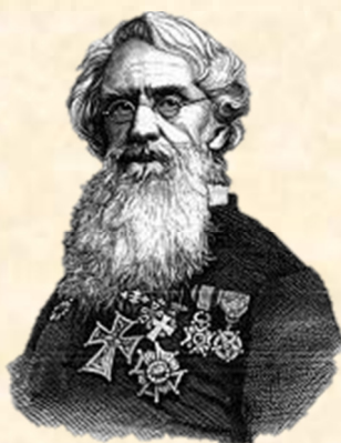
Jodocus van Haltna Hertog van Haltna Actief tot 23 november 2007