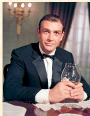
Johannes Stalin Actief tot 17 juli 2007