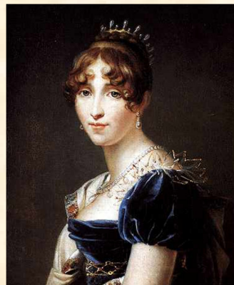
Charlotte de Bourbon Koningin van Batavië Actief tot 18 augustus 2010