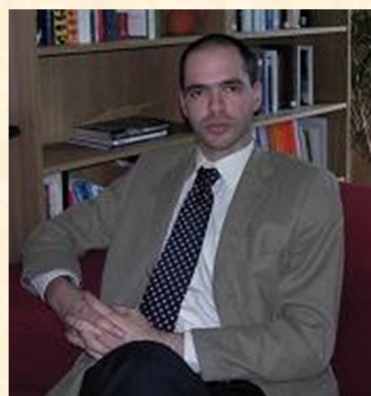
Gert Geens Sinds 10 april 2009 burger