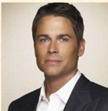
Kaynec Actief tot 22 januari 2007