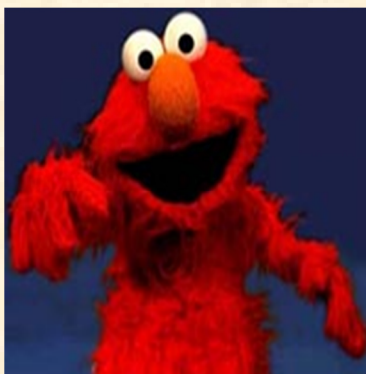
Roelof van Nederburg Groothertog van Nederburg Actief tot 4 januari 2009